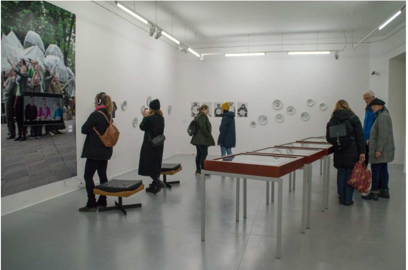
Z výstavy Senior linka v Stredoslovenskej galérii v Banskej Bystrici.

Stereotypný obraz seniora či depresívny tón je podľa nej dlhodobou osobitnou kapitolou v médiách. V televíziách sa dodnes objavujú kriminálne žánre o dôverčivých a oklamaných senioroch, najmä seniorkách, ktoré naleteli podvodníkom. Okrem populárnych programov to však vidieť aj v kultúrnych rubrikách niektorých mienkotvorných denníkov, ktoré sú presýtené nekrológmi umelcov.