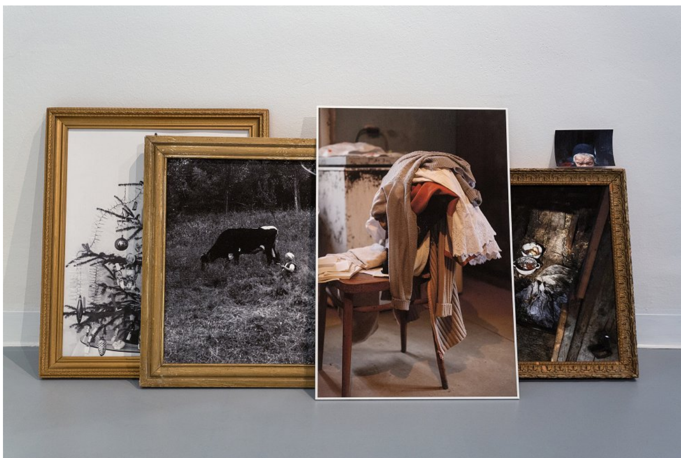
Z výstavy Senior linka v Stredoslovenskej galérii v Banskej Bystrici.