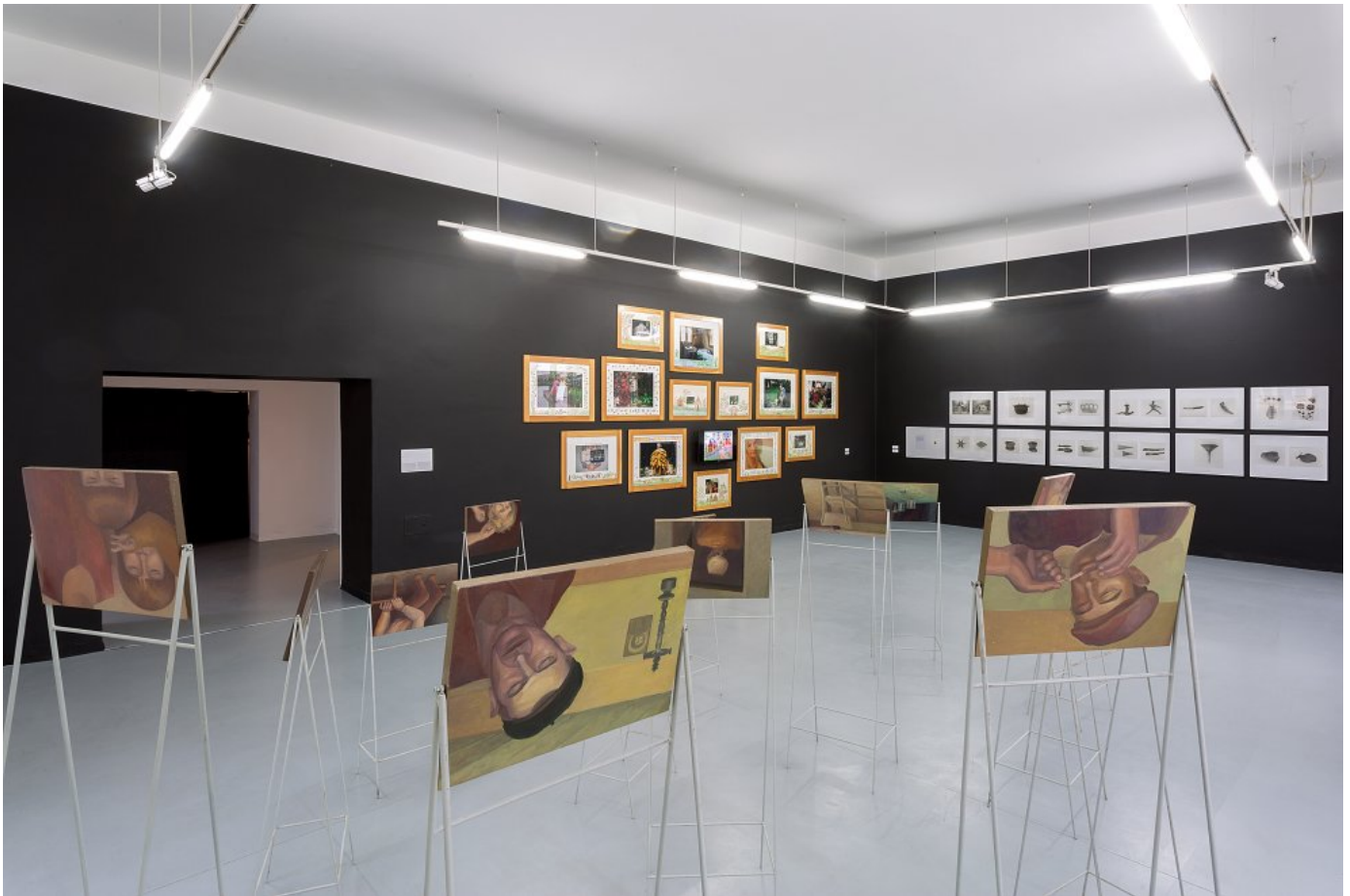
Z výstavy Senior linka v Stredoslovenskej galérii v Banskej Bystrici. výstava trvá do 2. apríla 2023.