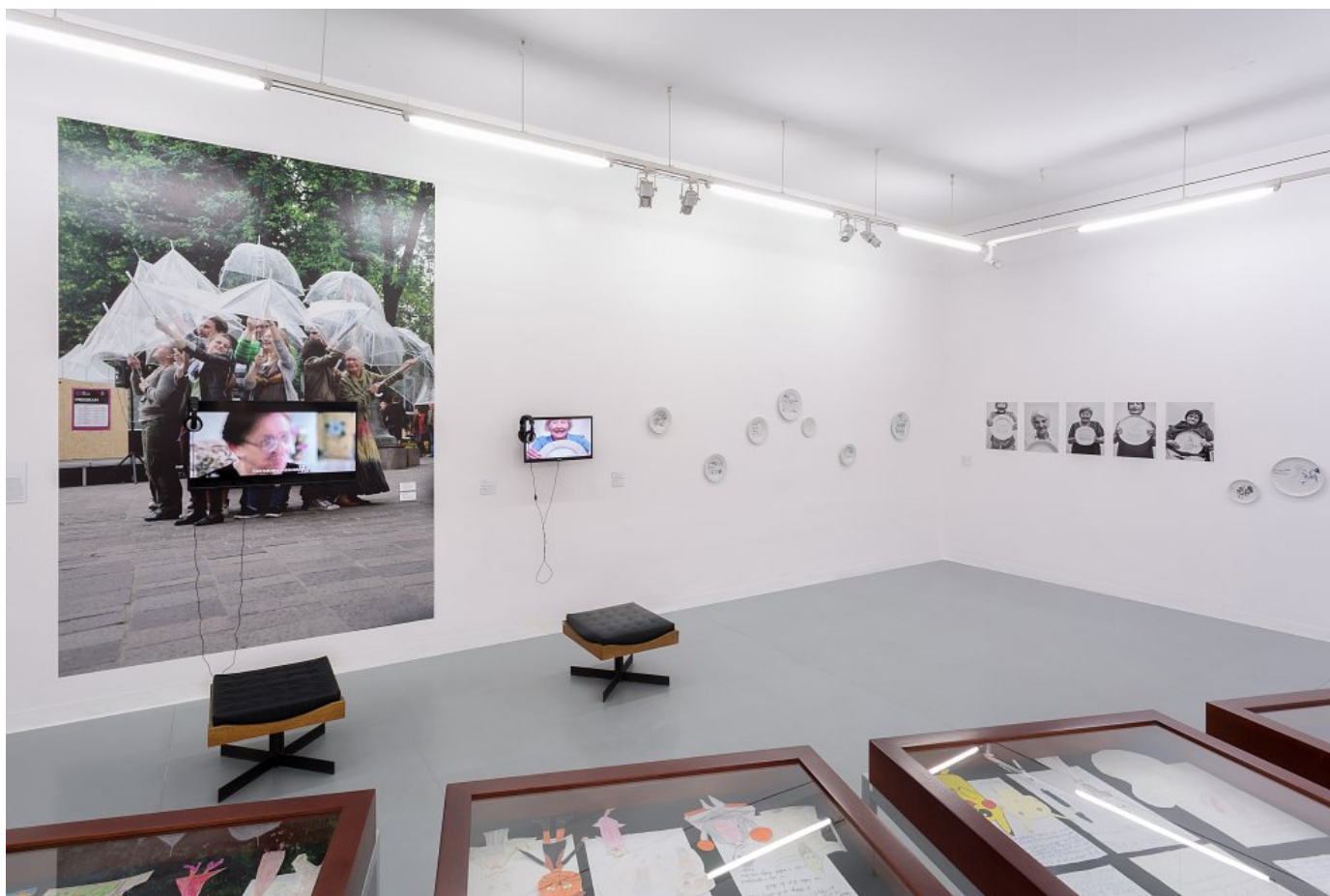
Z výstavy Senior linka v Stredoslovenskej galérii v Banskej Bystrici. výstava trvá do 2. apríla 2023.

Senior linka je aj názov aktuálnej výstavy v Banskej Bystrici. Pozostáva z umeleckých projektov slovenských a českých autorov a autoriek z posledných rokov, ktoré sú zamerané na seniorov. Tí však na rozdiel od situácie spred pár rokov nie sú odkázaní na pomoc druhých, ale ukazujú sa ako aktívni a vitálni ľudia, bez ktorých by jednotlivé diela nevznikli.