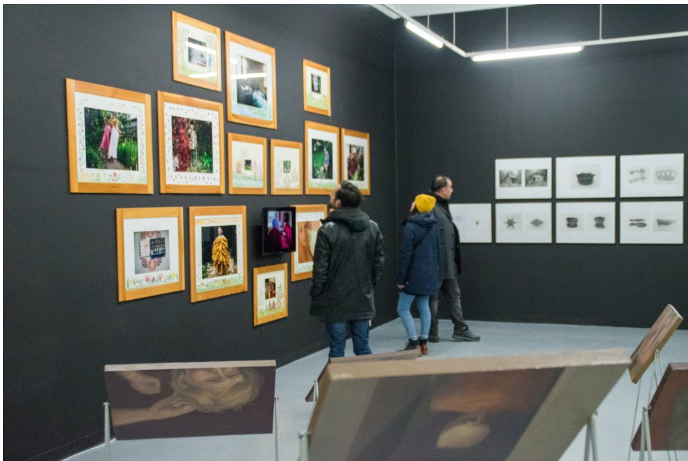
Z výstavy Senior linka v Stredoslovenskej galérii v Banskej Bystrici.