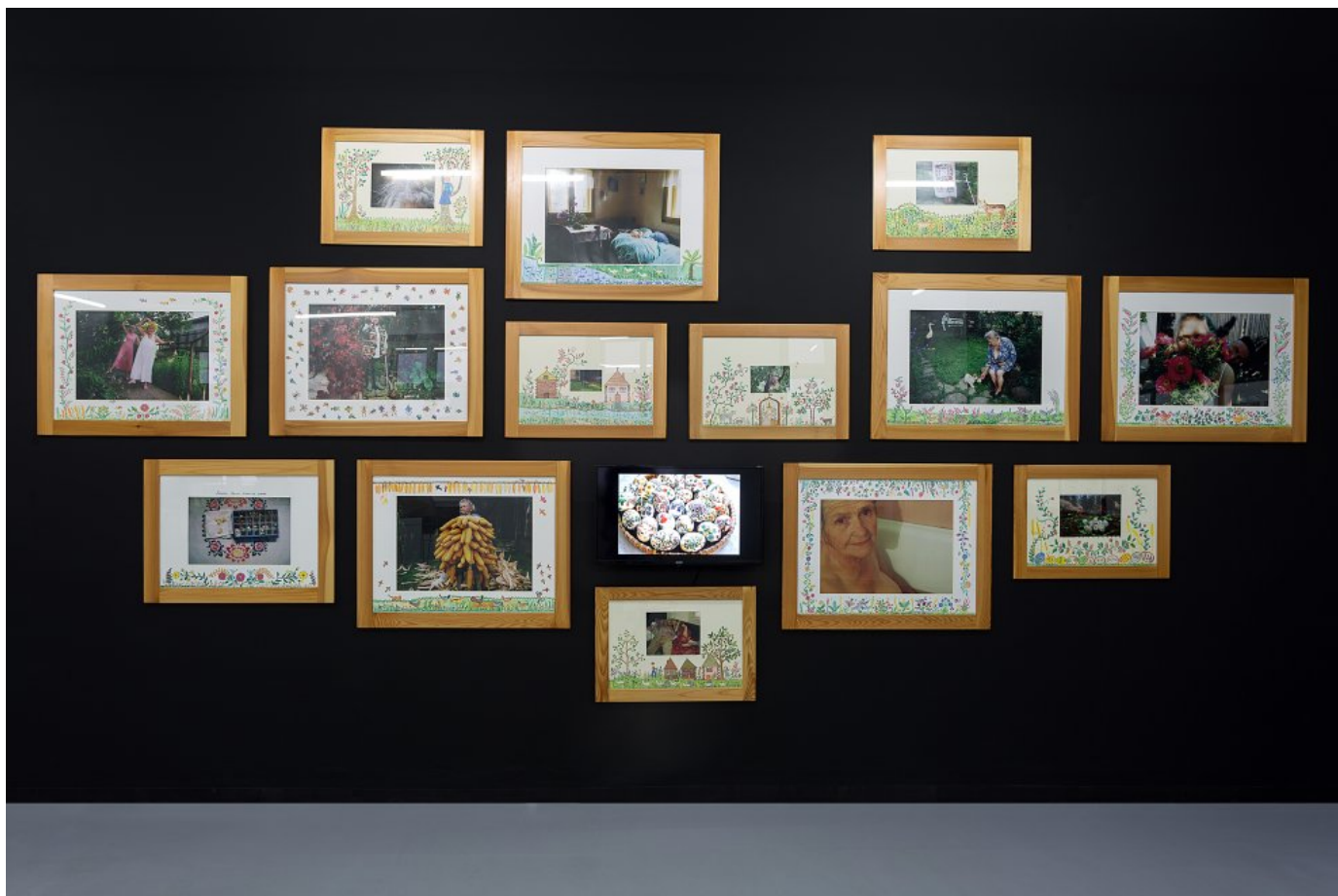
Séria Daniely Kapráľovej: Zuzanka, 2003 – 2008 na výstave Senior linka.