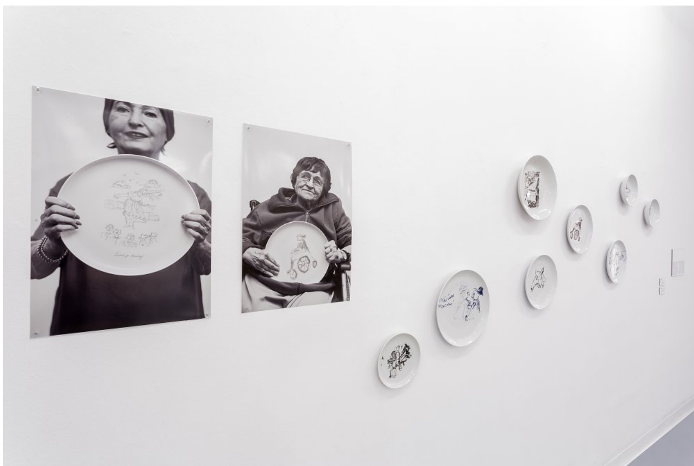
Projekt Lenky Záhorkovej: Tak to bolo, 2019, na výstave Senior linka.