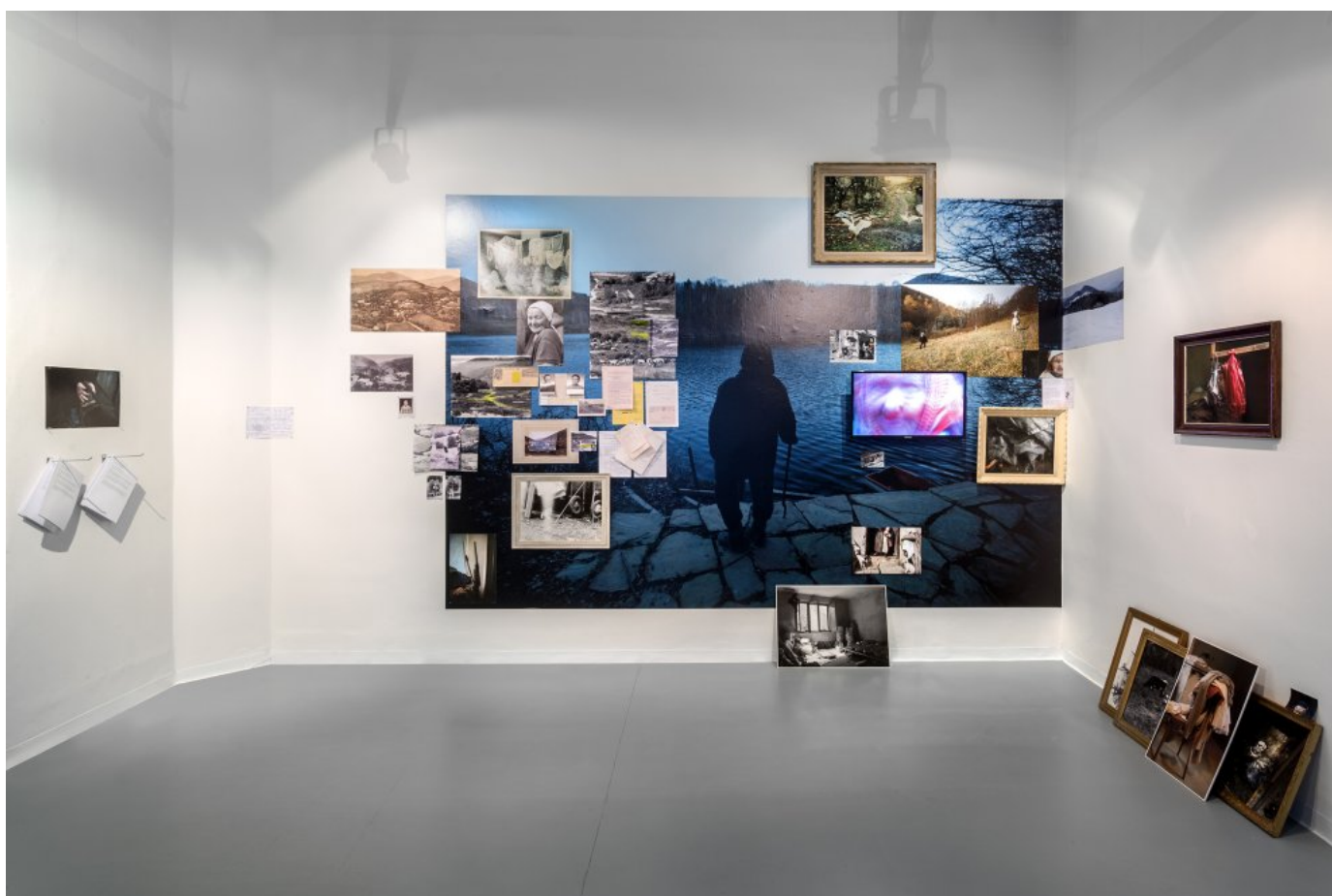
Séria Leny Jakubčákovej: Baba z lesa, 1998 – 2017 na výstave Senior linka.